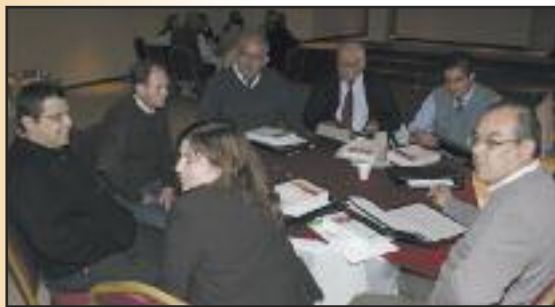
Curso de capacitación en Corrientes.

Presentamos a continuación los resultados que surgen del procesamiento de las encuestas individuales ordenados según las siguientes categorías: Cantidad de encuestas realizadas; Datos de los encuestados; Dolores y malestar; Principales problemas de salud; Tiempos y carga de trabajo; Riesgos psicosociales; Medicación, Atención Médica; e Información sobre ART.