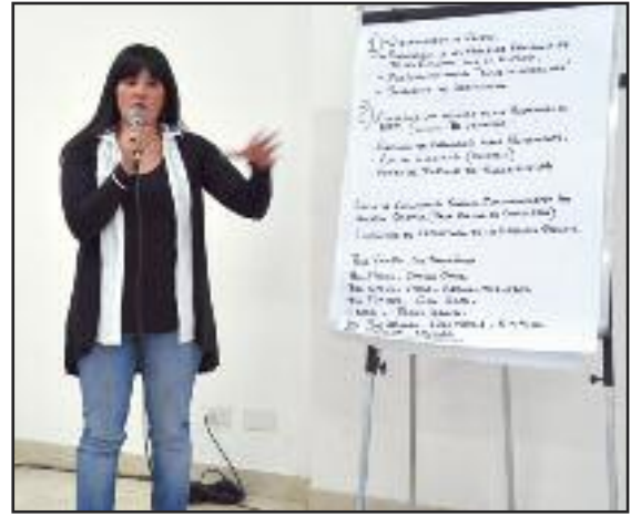
Capacitación en Viedma.

La amplia mayoría de los trabajadores bancarios sufre algún tipo de dolencia debido al trabajo y se encuentra medicado.