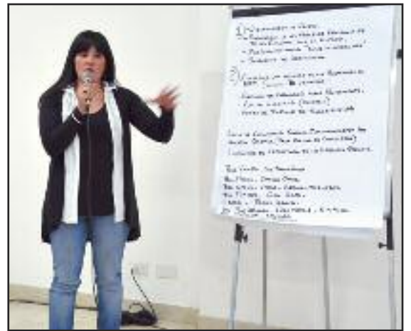
Capacitación en Viedma.

La amplia mayoría de los trabajadores bancarios sufre algún tipo de dolencia debido al trabajo y se encuentra medicado.