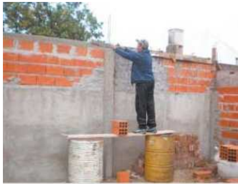
Lucha - El empleo informal empeora notoriamente la calidad laboral.